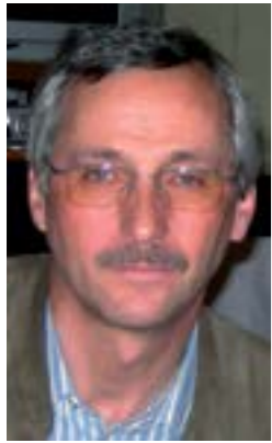
von Erwin Gritsch