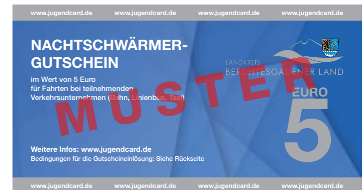
Im Bild: Vorder- und Rückseite des Nachtschwärmer-Gutscheins