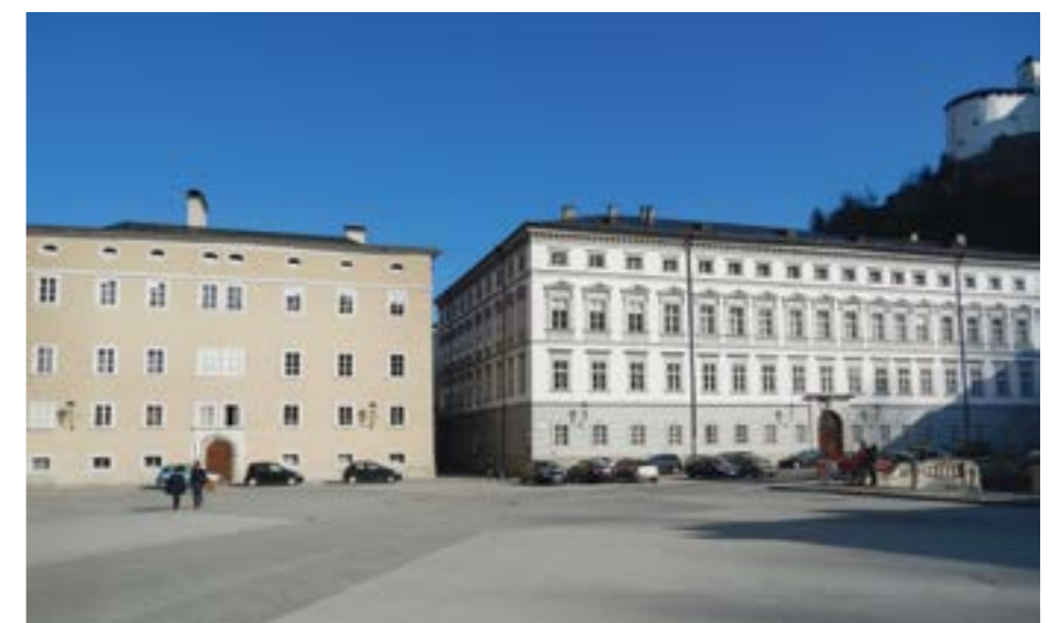
Foto oben: Das Erzbischöfliche Palais (r.) und die Dompropstei (l.)