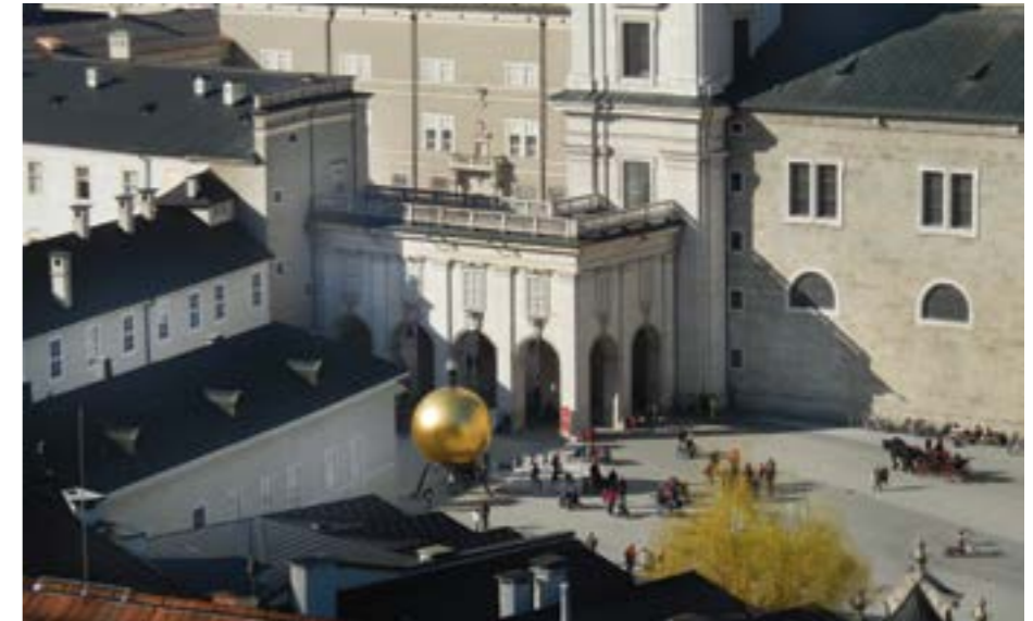
Foto oben: Blick auf den Kapitelplatz vom Festungsaufgang aus Foto unten: Die Balkenhol-Mozartkugel