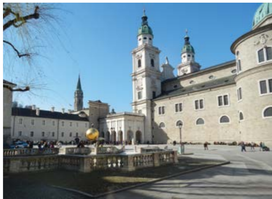
Im Bild der Kapitelplatz mit dem Salzburger Dom