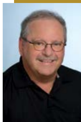
GF Peter Tutschku

Egal ob mit Funk oder ohne Funk-einrichtung als Taxi unterwegs, die Qualität im gesamten Gewerbe muss sich unbedingt erhöhen! Das Anforderungsprofil der Kunden an ein Taxi ist bekannt: Es sollte sauber sein und im Inneren des Taxis darf kein übler Geruch wahrgenommen werden. Die Marke des Fahrzeuges spielt heutzutage nur mehr eine untergeordnete Rolle beim Kunden.