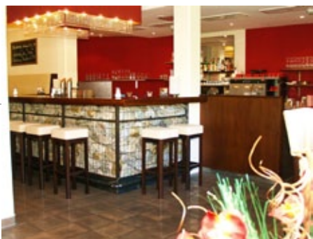
Bild oben und unten: Hotelbar und Eindrücke von der farbenfrohen Innenausstattung