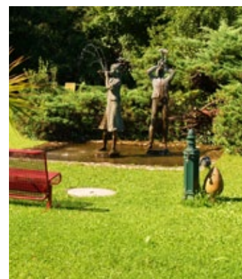
Auf „Entdeckungsreise“ im Grünen