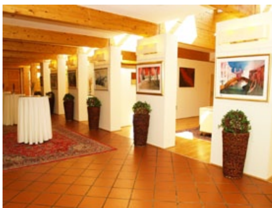
Im Hotel haben Künstler die Möglichkeit, Ihre Bilder auszustellen